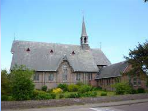
Voor de serieuze is er de Clemens kerk

Dit kerkje aan de Ballumerweg is gebruikt tot de St. Clemenskerk aan het Burenpad gereed kwam in 1879. De kerk doet tegenwoordig als boerderij dienst. De sporen van het verleden zijn met name bij de ramen nog goed zichtbaar.